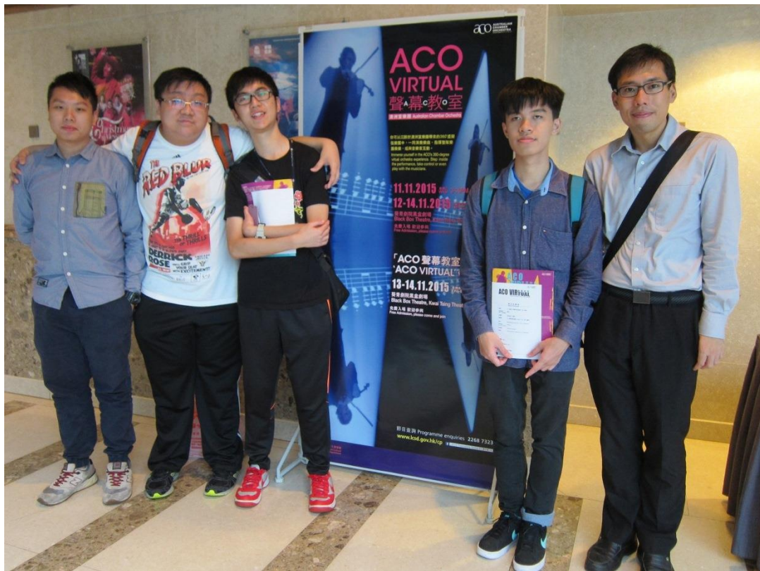
同學們與學生事務處同事一同拍照留念。

音樂是以聲音組成的藝術，它也是表達人類思想感情的媒介。音樂帶來聽覺的享受，它也是人與人之間溝通的良好橋樑。2015 年 11 月 13 日，香港能仁專上學院同學們結伴同行，到葵青劇院欣賞「ACO 聲幕教室」音樂會。在嶄新科技下，同學們沉醉於澳洲室樂團帶來的 360 度虛擬樂團中，享受巴赫、葛利格、史密里、皮亞梭拉等的樂曲。