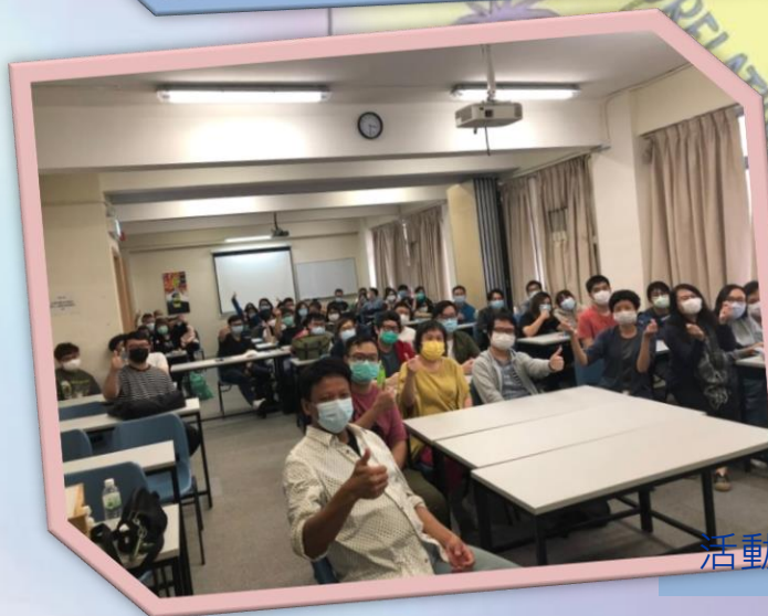
活動後來張大合照