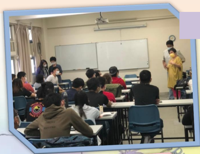
同學們細心地聆聽講者分享

除此之外，他們亦談及香港和英國在福利制度上的異同、社工在制度上可能遇上的限制。相信參與這次講座的同學都有所得著，對社工的專業責任及應具備的特質有更深一層認識。