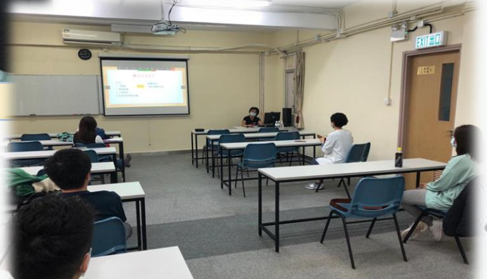
嘉賓正在向同學講解自閉症的特徵