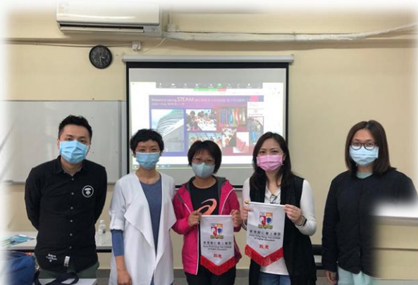
向嘉賓頒發紀念旗致謝

嘉賓在講座中以導師的角度分享了有關自閉症的資訊，當中包括徵狀及常見問題，亦分享了自身經驗及一些個案分享；而另一位嘉賓則以家長的身份分享了親身經驗，在子女面對專注力不足、自閉症等問題下如何協助及教養心得。使同學們了解到自閉症個案的實務處理及他們所面對的困擾和難處。